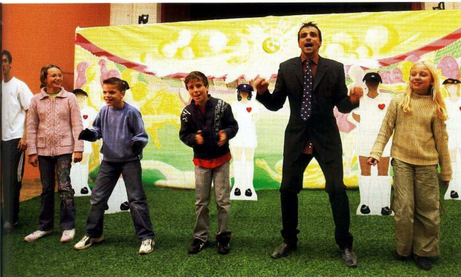
Le football contre la violence – Extrait d'une pièce de théâtre.

Afin d'impliquer les jeunes davantage et ce faisant les toucher dans leur for intérieur, ces derniers sont invités à devenir eux-mêmes acteurs des spectacles du Trimaran . Par exemple, pour Temps de Foot , la troupe pose ses valises pendant quelques jours au sein d'un collège ou d'un club. Après une demi-journée d'explication et de présentation du projet, différents ateliers sont choisis (théâtre, chant, chorégraphie, musique), puis ▶